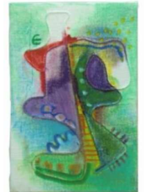
No.13「アナログフロッターージュ」