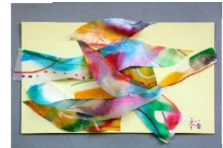
No.15「風の流れのコラージュ」