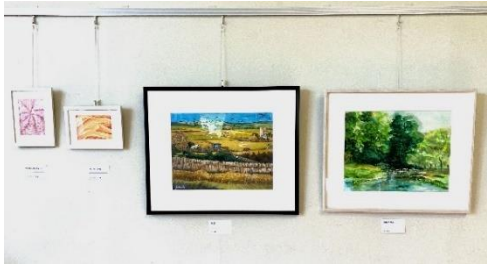
いろんな臨床美術作品の展示と臨床美術の書籍紹介コーナー