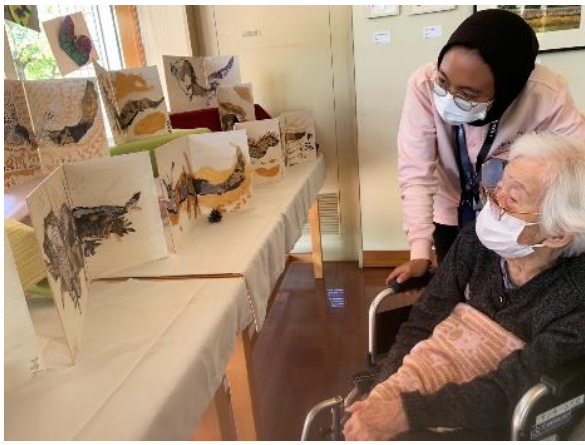
ご自分の 作品と ご対面