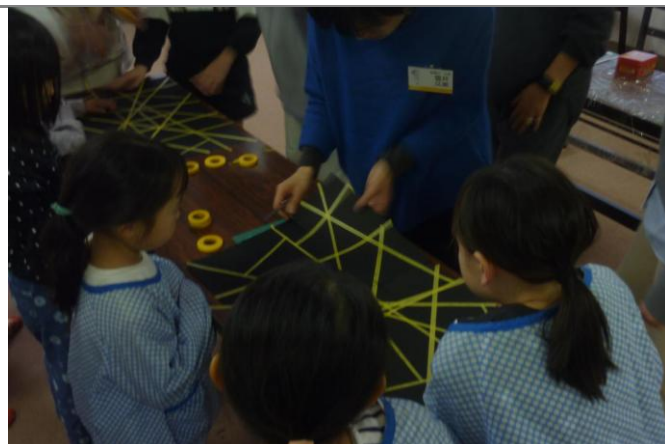
「光と色のステンドグラス」制作風景（12月15日）