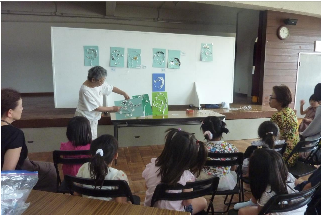
夏季講座「横顔レリーフ」鑑賞会(8月18日)