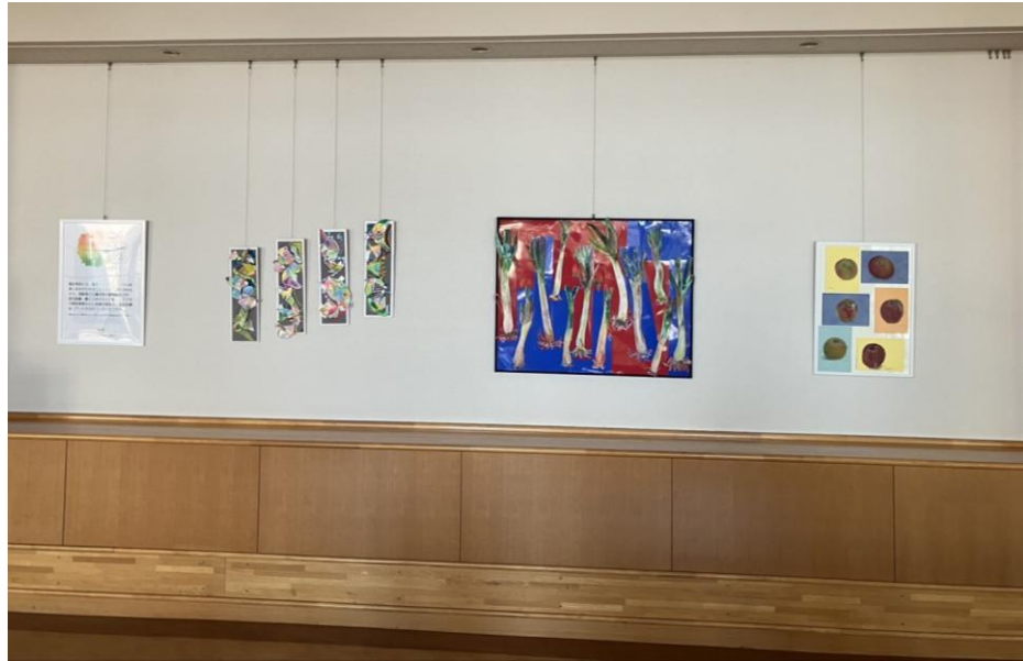
津島市民病院展示ギャラリー