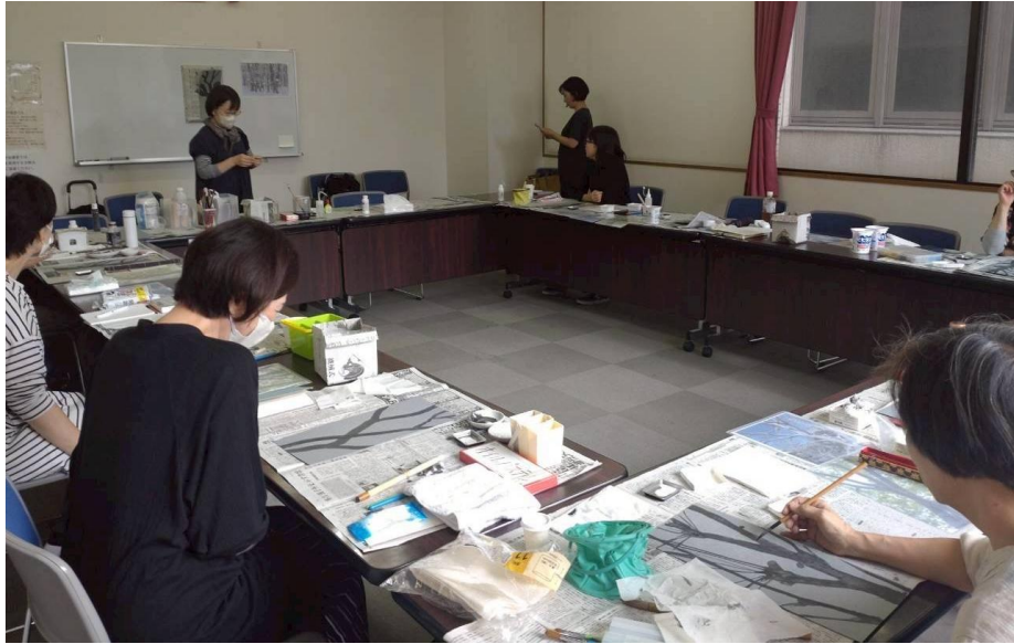
いーぶるなごや(名古屋市)