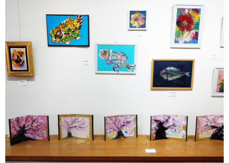
一宮市ギャラリー葵