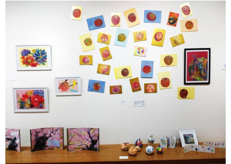
愛知医科大学病院内展示

https://www.instagram.com/reel/DH8ndo8y42s/?igsh=OHFI M3dtd3ZvMjM4