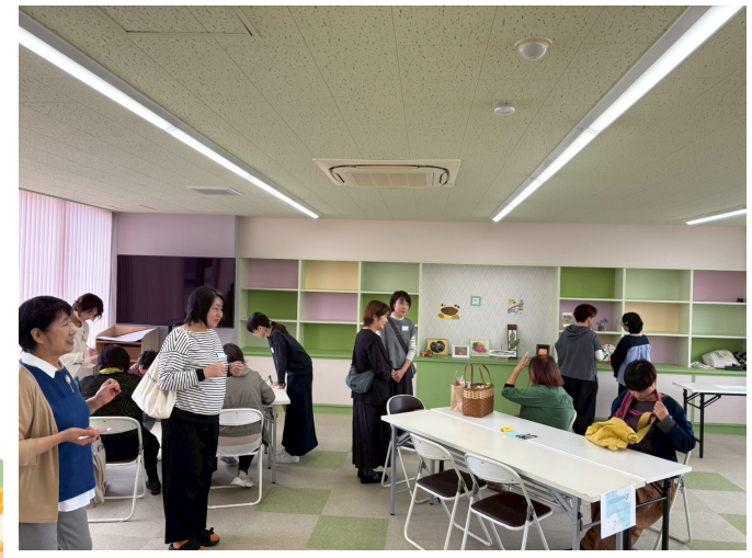
10月会員さん向け交流会開催