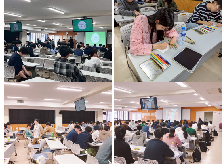
5月ヒューマンコミュニケーション授業 「鳥大医学部医学生」への授業の一環